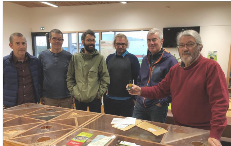
Conférence de presse pour le lancement du mois du Radon